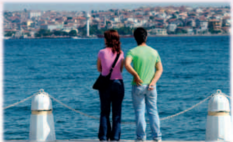
Κωνσταντινούπολη: η Τουρκία είναι υποψήφια προς ένταξη.

Εκτός από τις τρεις αυτές υποψήφιες χώρες, τέσσερα ακόμα κράτη των Δυτικών Βαλκανίων —η Αλβανία, η Βοσνία και Ερζεγοβίνη, το Μαυροβούνιο και η Σερβία— είναι δυνάμει υποψήφια για ένταξη. Η ΕΕ προσφέρει ήδη σε όλες τις χώρες των Δυτικών Βαλκανίων ελεύθερη πρόσβαση στις αγορές της για την πλειονότητα των εξαγόμενων προϊόντων τους και υποστηρίζει τα προγράμματα των χωρών αυτών για εγχώριες μεταρρυθμίσεις.