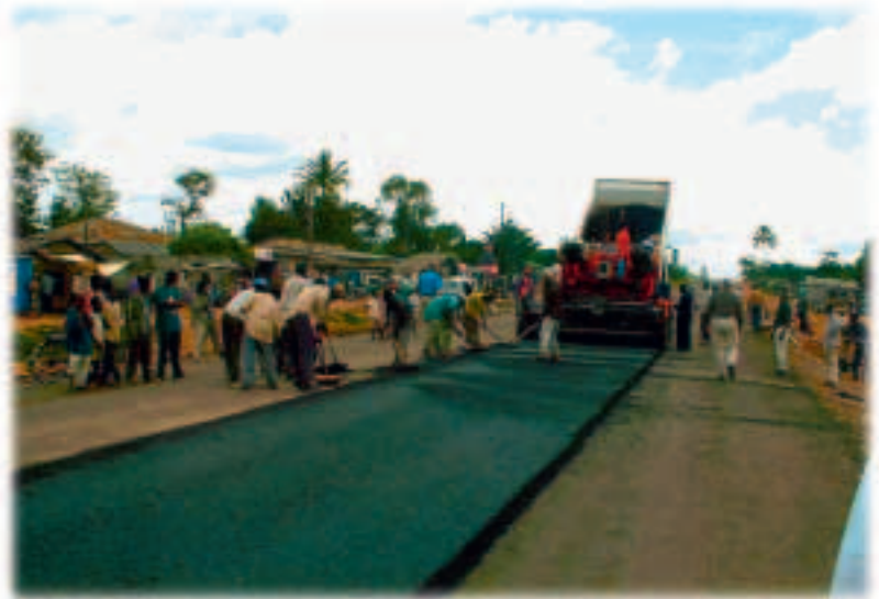
Η κατασκευή δρόμων που αντέχουν σε όλες τις καιρικές συνθήκες είναι ζωτικής σημασίας για την ανάπτυξη της Αφρικής.

Η ειδική σχέση ως προς το εμπόριο και τη βοήθεια μεταξύ της ΕΕ και των 79 χωρών της ομάδας ΑΚΕ (Αφρική-Καραϊβική-Ειρηνικός) ισχύει από την υπογραφή των συμφωνιών της Λομέ το 1975. Η σχέση αυτή αναπτύσσεται περαιτέρω μέσω των λεγόμενων «συμφωνιών οικονομικής εταιρικής σχέσης». Οι συμφωνίες αυτές συνδυάζουν το εμπόριο και τη βοήθεια από την ΕΕ μέσα από ένα νέο πρίσμα. Οι χώρες ΑΚΕ ενθαρρύνονται να καλλιεργήσουν την οικονομική τους ολοκλήρωση με γειτονικές χώρες ως ένα βήμα προς την ολοκλήρωσή τους στην παγκόσμια οικονομία, ενώ περισσότερη βοήθεια κατευθύνεται προς τη θεσμική ανάπτυξη και τη χρηστή διακυβέρνηση. Με τις συμφωνίες αυτές η αναπτυξιακή διάσταση γίνεται ο ακρογωνιαίος λίθος της σχέσης ΕΕ-ΑΚΕ.