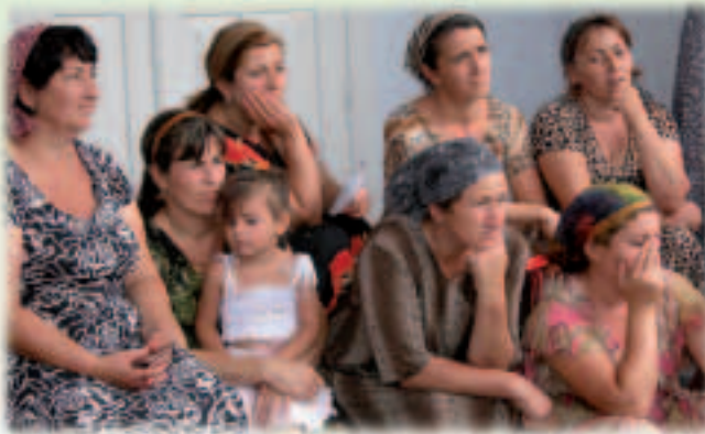
Γυναίκες στην Τσετσενία που παρακολουθούν προγράμματα αυτοβοήθειας.

Ενώ η κατάσταση έχει βελτιωθεί, επιτρέποντας στην ECHO να περιορίσει το πρόγραμμά της για πρώτη φορά από το 1999, υπάρχουν ακόμα πολλοί άνθρωποι που εξαρτώνται από τη χρηματοδότηση μέσω οργανισμών όπως ο Ερυθρός Σταυρός, η Ύπατη Αρμοστεία του ΟΗΕ για τους Πρόσφυγες και το Παγκόσμιο Επισιτιστικό Πρόγραμμα. Στο πλαίσιο του προγράμματός της, η ΕΕ χρηματοδοτεί δράσεις κατάρτισης του ευάλωτου τοπικού πληθυσμού οι οποίες αποσκοπούν στο να κάνουν τους ανθρώπους αυτούς περισσότερο αυτόνομους. Οι δράσεις αυτές περιλαμβάνουν επικερδείς δραστηριότητες, όπως οι οικοδομικές εργασίες και η φροντίδα θερμοκηπίων.