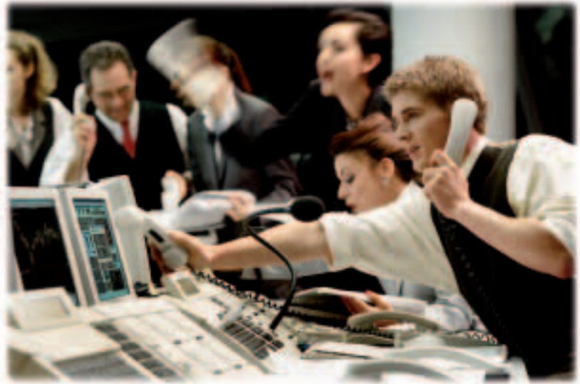
Το ευρώ έχει δυναμική παρουσία στις παγκόσμιες χρηματαγορές.

Η ΕΕ και επτά χώρες της νοτιοανατολικής Ευρώπης έχουν συστήσει μια ενιαία ενεργειακή κοινότητα στην οποία ισχύουν οι ίδιοι κανόνες της αγοράς ενέργειας για όλους. Η ΕΕ επιτυγχάνει έτσι μεγαλύτερη ασφάλεια ως προς την προμήθεια φυσικού αερίου και ηλεκτρικής ενέργειας που γίνεται μέσω των συγκεκριμένων χωρών, ενώ παράλληλα και οι αγορές ενέργειας των χωρών αυτών διασφαλίζουν περισσότερη αποτελεσματικότητα καθώς εφαρμόζουν ευρωπαϊκούς κανόνες και πρότυπα.